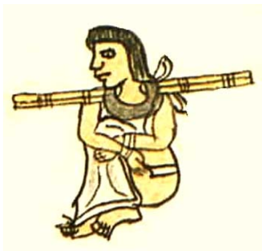
Рис. 1. Деревянный ошейник на выставленной на продажу ацтекской рабыне; на этом древнем рисунке изображен и куэйтль – специальная одежда (юбка), которую могли носить только рабы и которая являлась отличительным признаком невольника от свободного.

Пути эмансипации (т.е. освобождения от невольничества) были как классические (то есть самовыкуп, дарование «вольности» господином, освобождение за особые заслуги), так и весьма экзотические, характерные только для цивилизации мешика (в частности, если продающийся раб на рынке сумел сбежать и наступить на экскременты человека, то он мог обратиться к судьям с просьбой об освобождении; см., напр., Orozco y Berra, 2012 ).