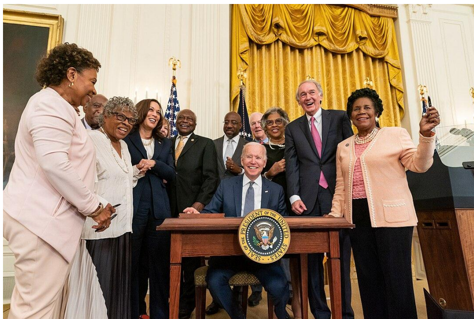
Рис. 1. 46-й Президент США Джозеф Робинетт Байден-младший подписывает Акт о Дне национальной независимости 19 июня, 17 июня 2021 года

В свете сказанного, сложно переоценить принятие «Акта о Дне национальной независимости 19 июня» (англ. Juneteenth National Independence Day Act) для упрочнения американской государственности. Данный документ был принят Конгрессом США и подписан Президентом Дж. Байденом 17 июня 2021 года (см. Рисунок 3 ). Акт обязывает считать 19 июня федеральным (т.е. общегосударственным праздником) во всех без исключения штатах.