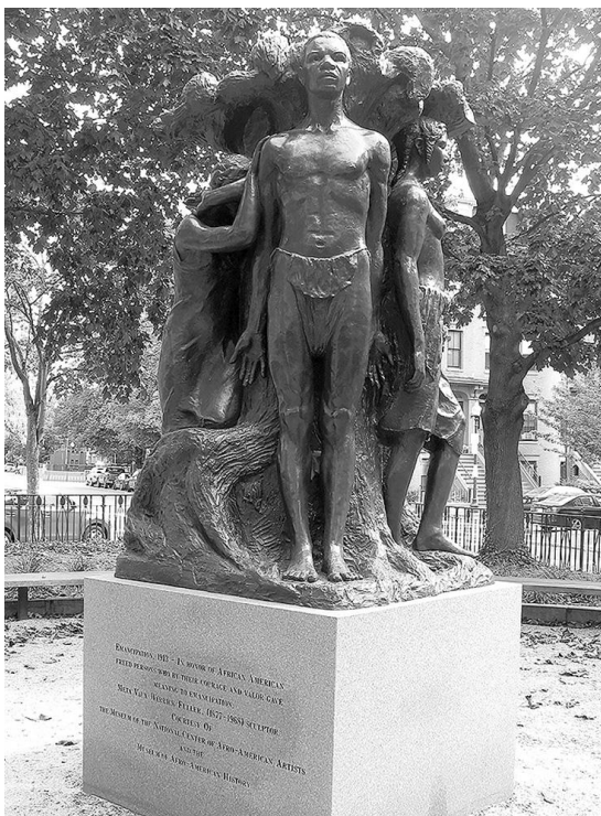
Рис. 2. Памятник «Освобождение рабов» (г. Бостон, Массачусетс), созданный в 1913-м году (Бондаренко, 2023: 152).

Однако до определенного времени «Juneteenth» никогда не пользовался признанием со стороны государства. В эпоху Реконструкции и Джима Кроу лишь немногие штаты бывшей Конфедерации были заинтересованы в праздновании эмансипации. А поскольку многие афроамериканцы мигрировали на север, особенно в эпоху Великой депрессии, «Девятнадцатое июня» стал практически забытым пережитком времен Гражданской войны.