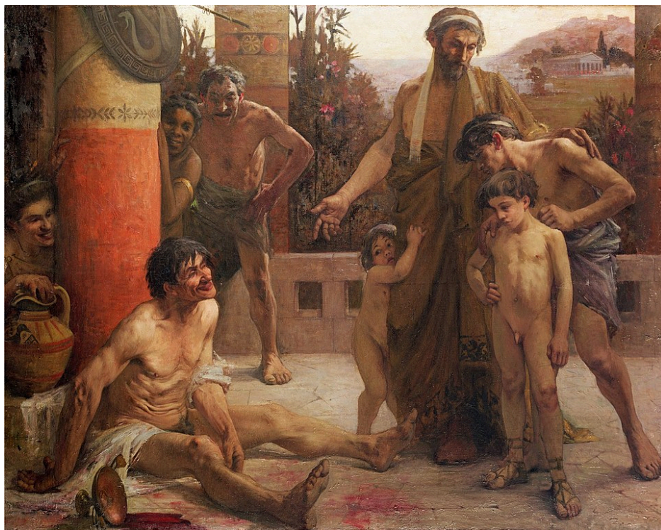
Рис. 2. Ф. Сабатте «Спартанец, показывающий пьяного илота своим сыновьям». 1900.

периоду принципата рабов использовали чисто экономически, перестав в них видеть человека как такового, были ли это сельско-хозяйственные или строительные работы, либо выступление наравне с животными на гладиаторской арене.