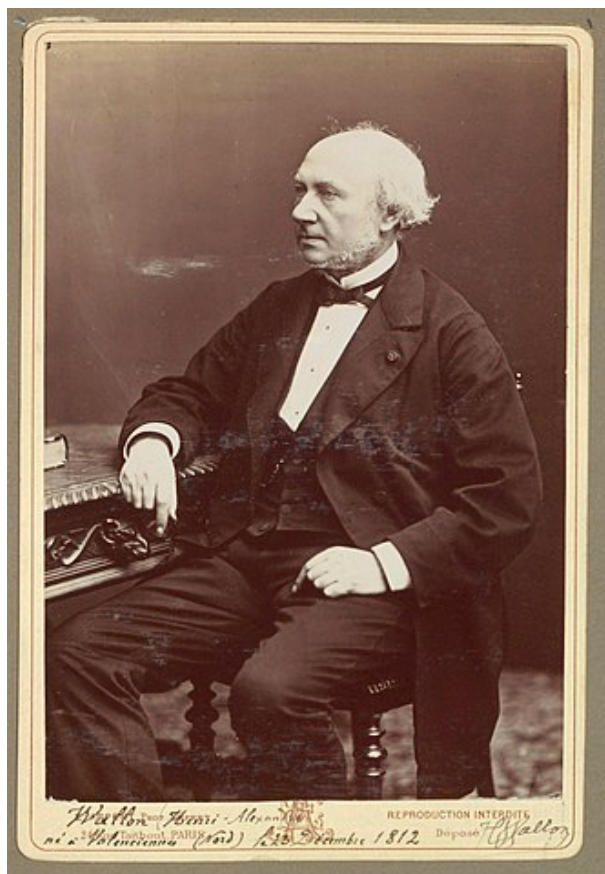
Рис. 1. Автор французской конституции 1875-го года, историк, министр народного просвещения, сенатор Анри Александр Валлон (1812–1904)

Анри Александр Валлон (Рисунок 1) родился в г. Валансьен в провинции Пикардия, расположенной на самом севере Первой Французской империи (современный регион О-де-Франс, или Верхняя Франция) 23 декабря 1812-го года.